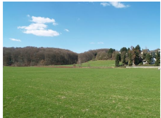
Am Geus Garten